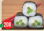
Vegetarisch grüner Spargel, Remoulade