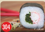
Kani Lauch Krebsfleischimitat, Lauch, Frischkäse