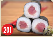
Tekka Maki Thunfisch