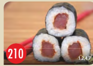
Spicy Tuna scharfer Thunfisch