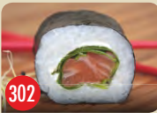
Sake Spinat Lachs, Spinat, Frischkäse