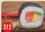
Sake Avocado Lachs, Avocado