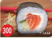
Sake Kappa Lachs, Gurke, Frischkäse