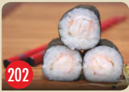
Ebi Maki Riesengarnele