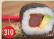
Spicy Tuna Avocado scharfer Thunfisch, Avocado