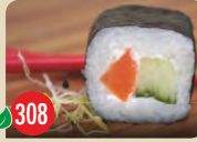
Vegetarisch Gurke, Möhre, Frischkäse