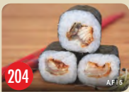
Unagi Maki gegrillter Aal