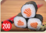
Sake Maki Lachs