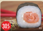
Taiyo Rolle Räucherlachs, Frischkäse