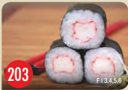
Kani Maki Krebsfleischimitat