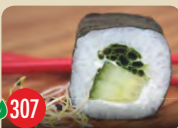
Vegetarisch Gurke, Lauch, Frischkäse