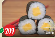
Vegetarisch japanisches Omelett